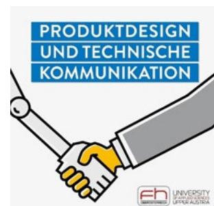
Klicken Sie hier , um zu unserer Podcast-Reihe zu kommen!