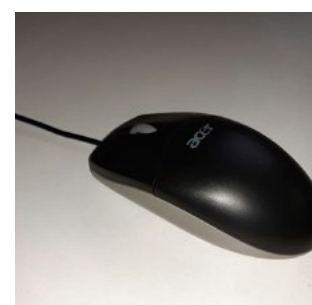
Die ursprüngliche deutsche Bezeichnung von Computermäusen? Zur Lösung geht es hier !